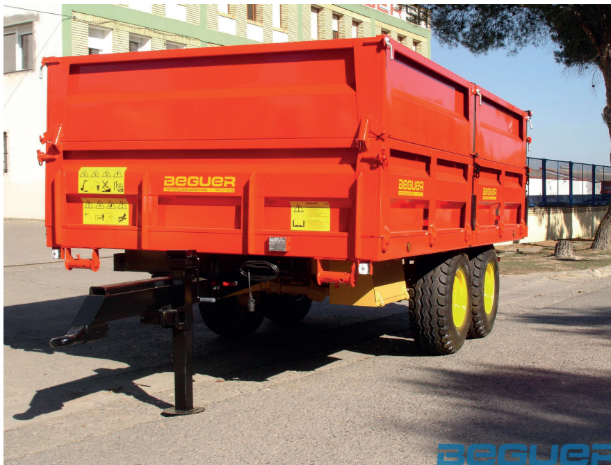
Algunas características pueden no coincidir con la imagen